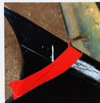
Limbånd: Bruk gjerne «rallytape» til å holde bitene i riktig posisjon. Slik tape legger ikke igjen limrester når du tar den av.