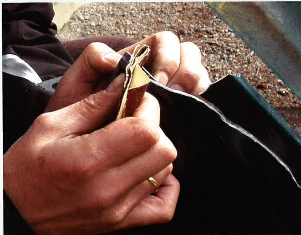
Fuge: Først sliper vi en litt skrånende limfuge med grovt slipepapir.