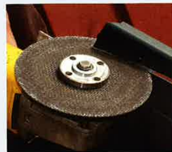
Kutteskive: Vil du lage plass for en litt større limfuge, kan du bruke vinkelsliper med kutteskive.