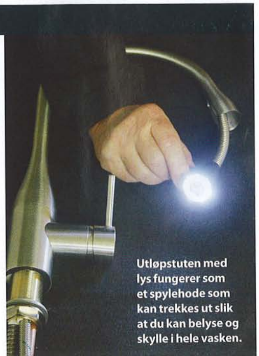
Utløpstuten med lys fungerer som et spylehode som kan trekkes ut slik at du kan belyse og skylle i hele vasken.